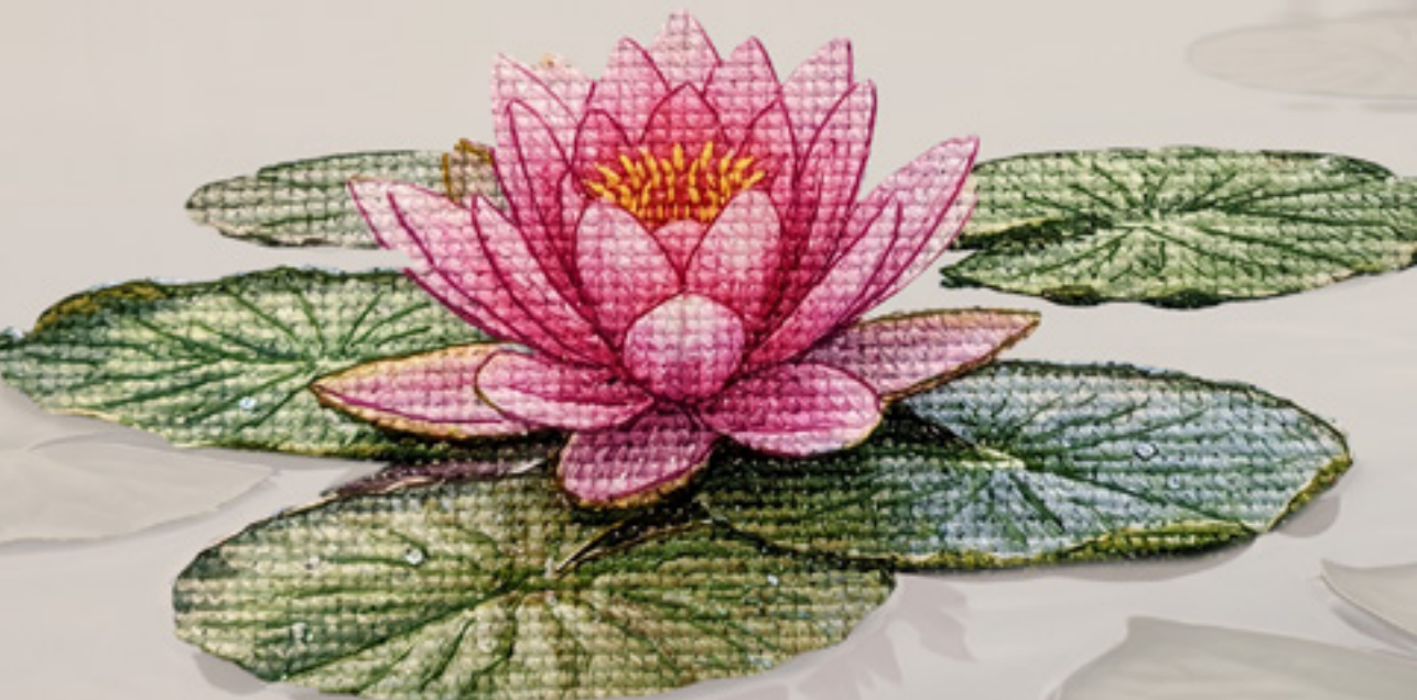
מחכה לך בקו לבנות, שלוחה 4