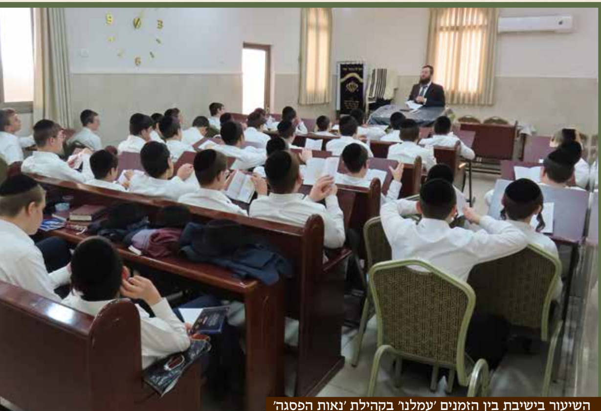
השיעור בישיבת בין הזמנים 'עמלנו' בקהילת 'נאות הפסגה'

צעירים שיכתבו הערות וקושיות שעלו להם, זה גורם לבחור להבין ולהעמיק יותר במה שלומד."