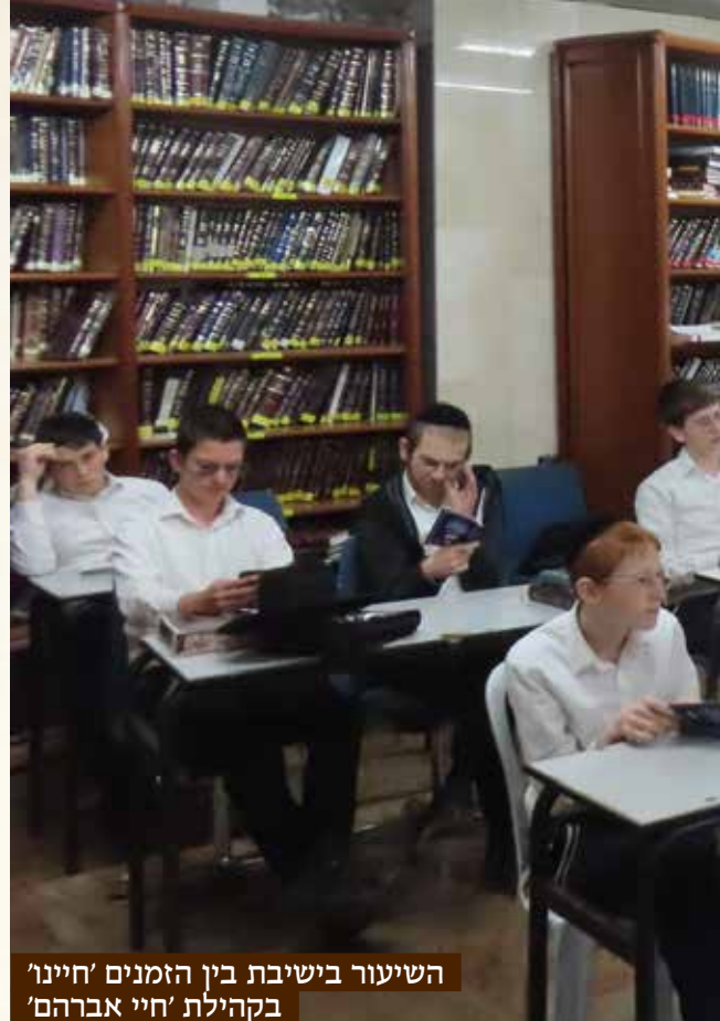
השיעור בישיבת בין הזמנים ‘חיינו’ בקהילת ‘חיי אברהם’

”אחת ליומיים או שלוש אני שואל את הבחורים שאלה מאתגרת מתוך הסוגיית הנלמדת”, משתף הרב אלחנן, “ובכל פעם אני נדהם מהבקיות