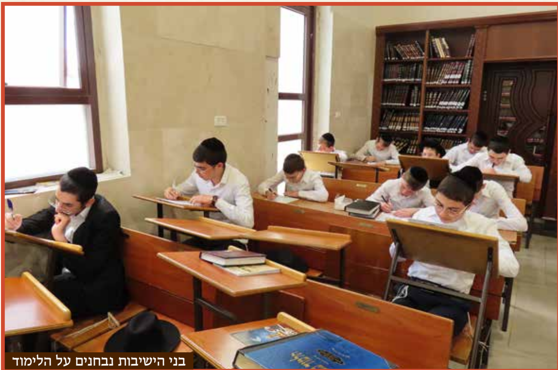
בני הישיבות נבחנים על הלימוד

הגמרא, מוסיפים את דברי הראשונים ומרחיבים את התשובה בצורה יוצאת דופן.